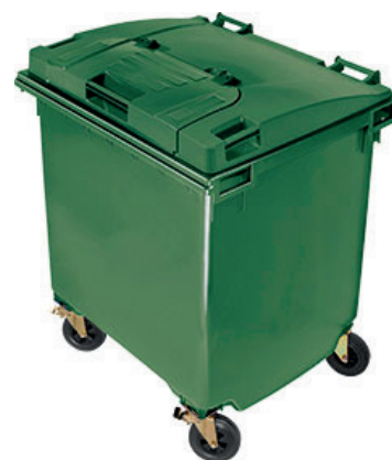
POJEMNIK ZIELONY - szkło