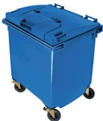
POJEMNIK NIEBIESKI - papier

Nowe mają natomiast dodatkową, małą, wygodną w użytkowaniu klapę.