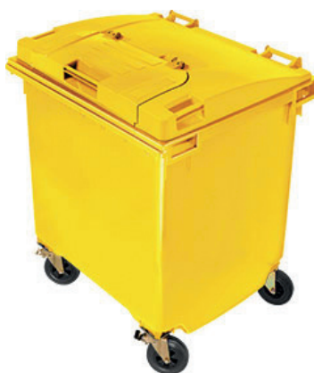
POJEMNIK ŻÓŁTY - metale i tworzywa sztuczne